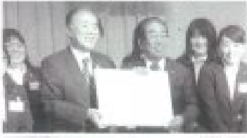
新木アソナー工業 第43期経営方針発表会

発表会では、社長が経営方針を説明し、役員が各部署の目標を発表した。社長は「2022年に庶民の時代来る」と語り、社員一丸で発展と成長を遂げることを誓った。